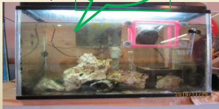
お隣に赤ちゃん専用水槽