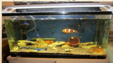
ニモ君たちの水槽

水槽のどこかに隠れながら、さらに小さなえさを食べているようです。色はまだ黒色ですが、早くお母さんに負けないくらい大きく、綺麗に