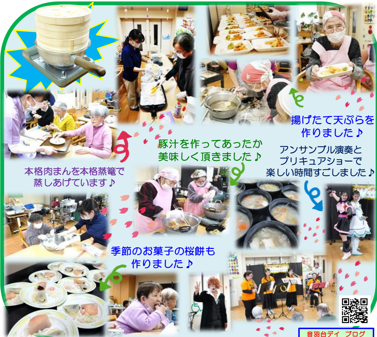
本格肉まんを本格蒸籠で蒸しあげています♪